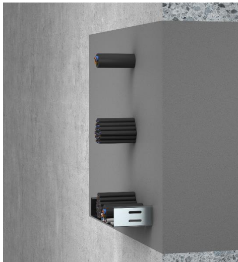
Kabelabschottung mit MK 20 CompaKal in einer Massivwand